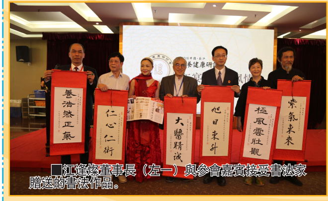
江達燦董事長(左一)與參會嘉賓接受書法家贈送的書法作品。