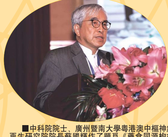
中科院院士、廣州暨南大學粵港澳中樞神經再生研究院院長蘇國輝作了題為《藥食同源枸杞子·神經保護與養生》的主題報告。