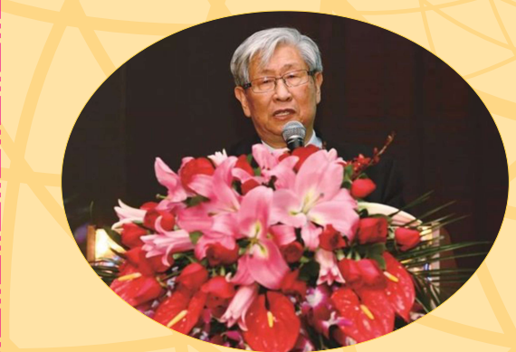
中國工程院院士、天津藥物研究院名譽院長和學術委員會主任劉昌孝作了題為《環境與養生》的主題報告。