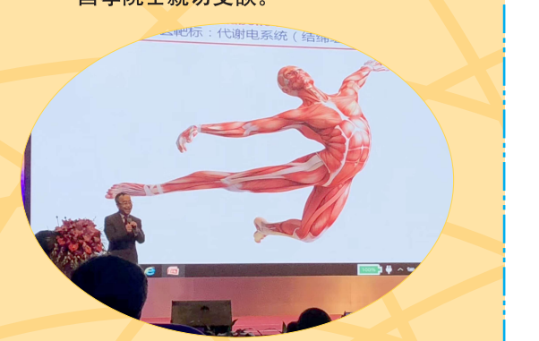
現場分析人體的健康特征。