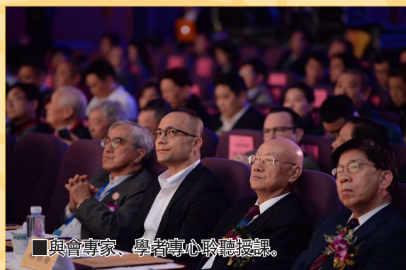
與會專家、學者專心聆聽演講。