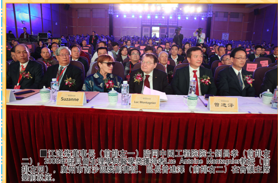
江達燦董事長(前排左一)陪同中國工程院院士劉昌孝(前排左二)、2008年諾貝爾生理學或醫學獎獲得者Luc Antoine Montagnier教授(前排左四)、廣州市南沙區委副書記、區長曾進澤(前排右二)在會議主席臺前就座。

醫學的優勢和特色，為中醫藥的發展提供新的思路。 在研討會上，中國工程院院士劉昌孝，2008年諾貝爾生理學或醫學獎獲得者、法國國家科學研究中心榮譽教授Luc Antoine Montagnier分別作了《環境與養生》、《自然健康長壽與中國醫養》的專題報告，另有6位專學、學者作了醫學、養生等相關的專題報告。報告圍繞當前社會發展形勢和國家最新政策分析了我國健康產業發展的最新趨勢。 指定為會議指定用茶，體現了會議主辦者的良苦用心。通過品味陳皮金茯苓茶引出食療對人體健康的重要性，陳皮金茯苓茶所用的原料新會陳皮及安化黑茶都是中國發酵茶(中藥)的代表。它們也是中國中醫幾千年總結出來可以通過長期存放并發酵對人體產生特殊功效的重要中藥成分之一。陳皮金茯苓茶將二者相結合，長期飲用達到養生目的，這也正是本次醫養論壇的主題以養為主、以醫為輔，達到人體健康長壽的目的。