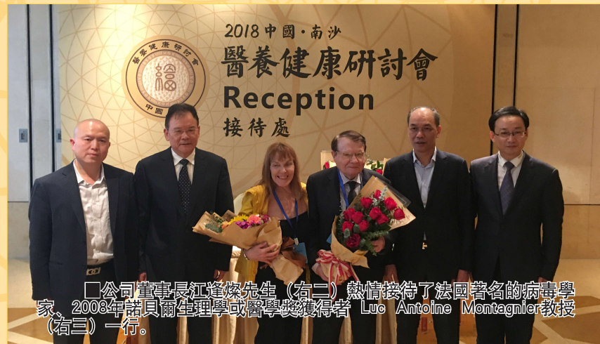
2018中國·南沙醫養健康研討會 Reception 接待處