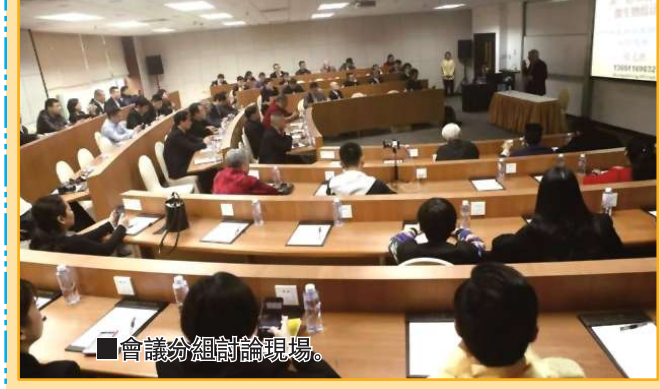
會議論壇討論現場。