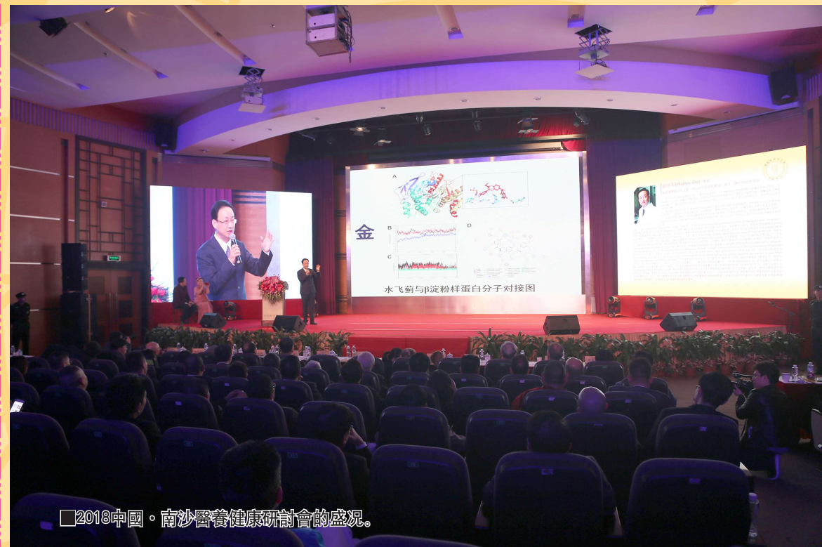
2018中國·南沙醫養健康研討會的盛況。