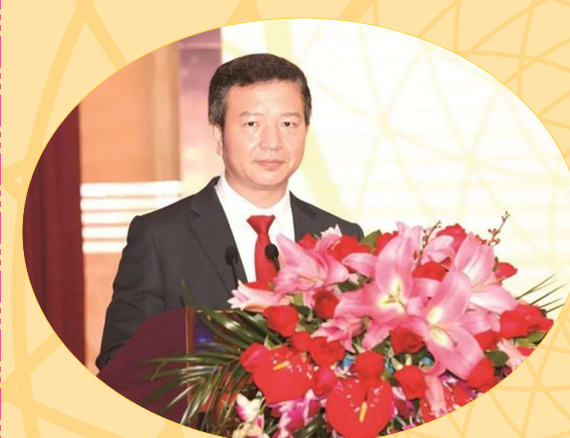
廣州市南沙區委副書記、區長曾進澤為本次活動致辭。