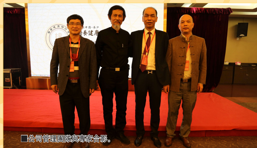
公司管理團隊與專家合影。