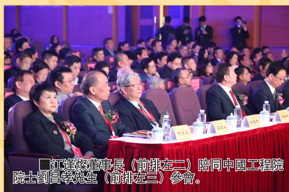
江達燦董事長(前排左二)陪同中國工程院院士劉昌孝先生(前排左三)參會。