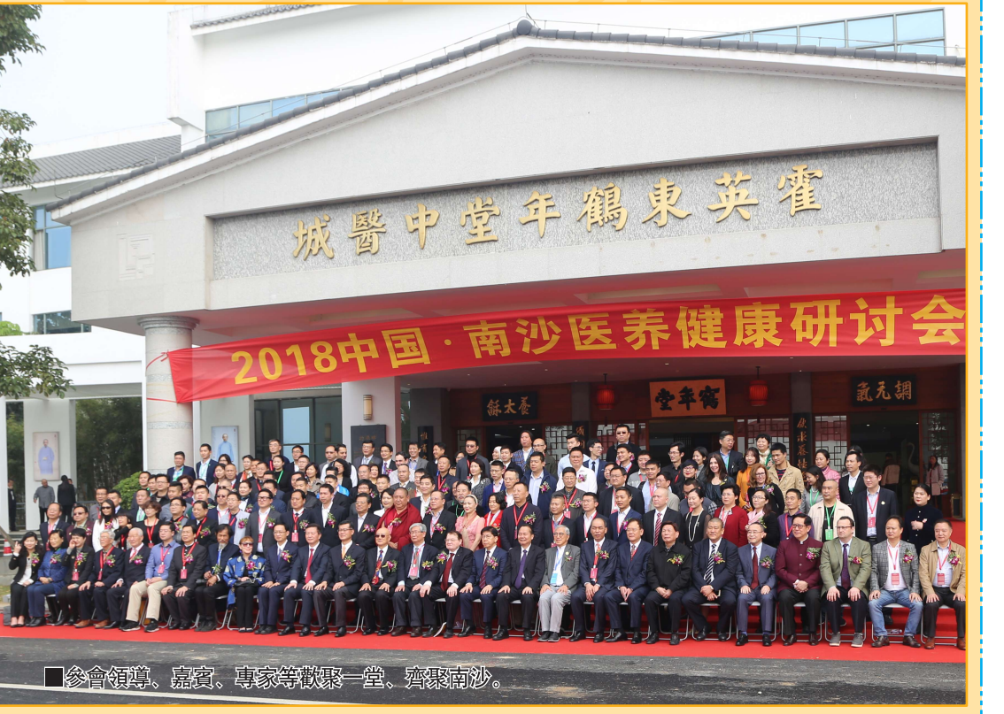
參會領導、嘉賓、專家等歡聚一堂，齊聚南沙。