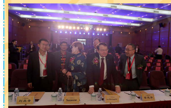
會議間隙相互討論。