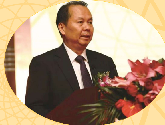
廣東省衛生和計劃生育委員會副主任徐慶鋒在會上講話。