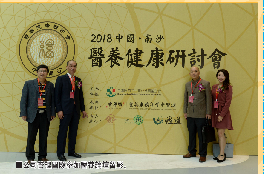
公司管理團隊參加醫養論壇合影。