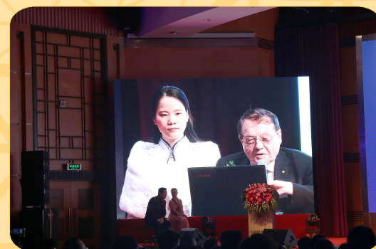
2008年諾貝爾生理學與醫學獎獲得者、法國國家科學研究中心榮譽教授Luc Antoine Montagnier作了題為《自然健康長壽與中國醫養》的主題報告。