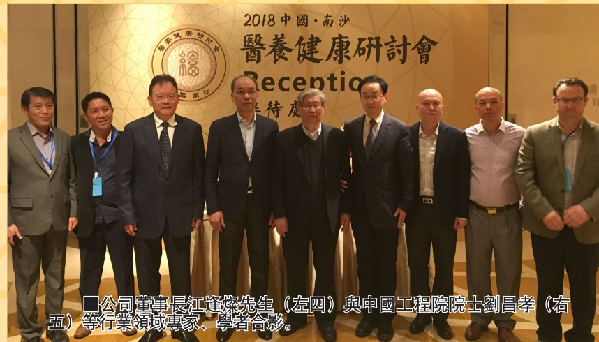
2018中國·南沙醫養健康研討會 Reception 接待處