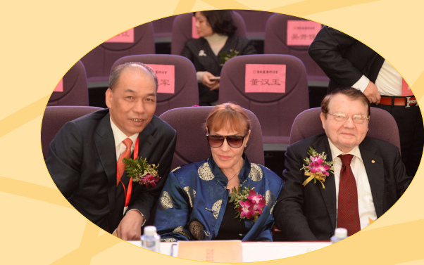
江達燦董事長(左一)與諾貝爾醫學獎獲得者Luc Antoine Montagnier教授(右一)親切交談。